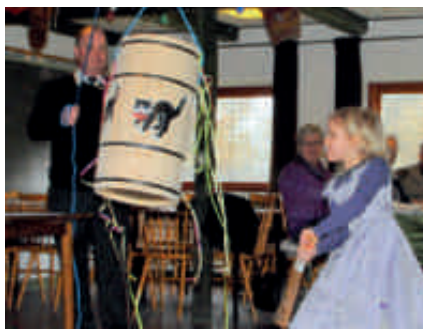
Fastelavn i Majbølle.

af dette års katekonger og -dronninger i det efterfølgende arrangement i Majbølle Præstegård.