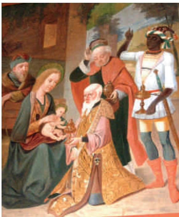
I Betlehem - fra Saksøbing Kirkes altertavle.

Det kan være sorgen over det, der ikke lykkes for os - enten ud fra vores egne forventninger, eller i forhold til