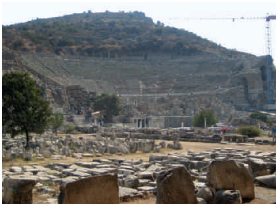
Teateret i Efesus, en af "Åbenbarings-byerne".

Denne skik kommer fra England, og består i oplæsningen af ni Bibeltekster, som fortæller hovedlinien i Bibelhistorien: skabelsen, syndefaldet, profetierne om den kommende Frelser, og deres opfyldelse, da Jesus kommer til verden. Teksterne ledsages af advents- og julesalmer sunget af Kirkemusikskolens kor.