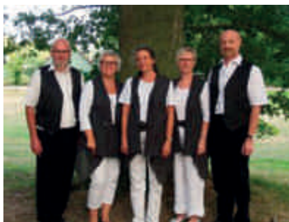
Den Voxne kvartet.

Onsdag den 29. januar kl. 19.00 får vi besøg af den Voxne kvartet og Fotokartellet fra Nykøbing, som vil opføre en såkaldt billedkoncert. Et